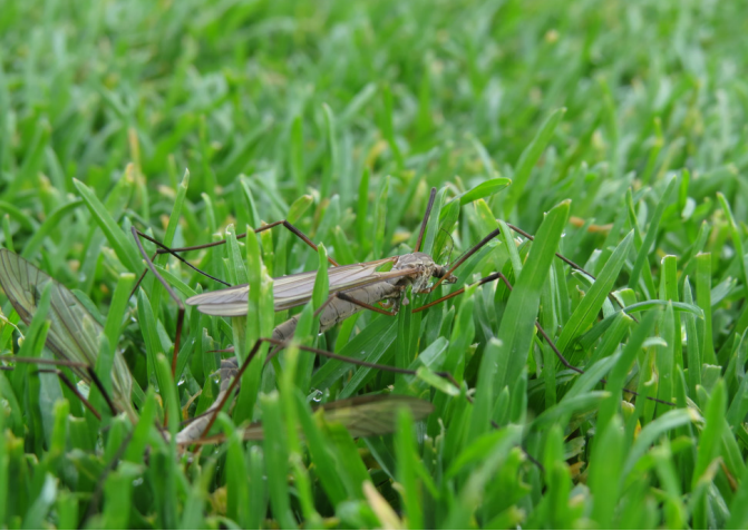
Kuva 1. Luhtakaalikirsikkään ( Tipula subcunctans ) parittelu Turun Ruissalon golfkentällä. Kuva A. Karhilahti.