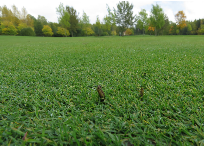
Kuva 2. Luhtakaalikirsikkään ( Tipula subcunctans ) kotelaita Turun Ruissalon golfkentällä.