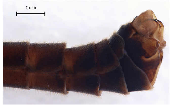
Kuva 4. Luhtakaalikirsikkään ( Tipula subcunctans ) koiraan hypopygium sivusta kuvattuna.