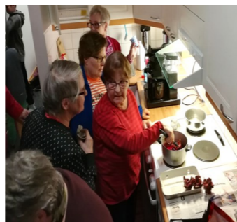
Kuva: Lohinivan ja Porokarin yhteisessä työpajassa tutustuttiin syttöruusujen tekoon.

Kesällä 2017 käynnistyi Rovaniemen Neuvokkaan hanke Elävät kylät – kulttuurista voimaa vapaaehtoistyöstä 2017 -2019. Hanketta rahoittaa Peräpohjolan Leader ja Euroopan maaseuturahasto. Hankkeessa perustetaan uusia kohtaamispaikkoja Rovaniemen kylien alueelle, nostetaan kylien asukkaita vapaaehtoistyöhön ja vahvistetaan kylien vapaaehtoisten osaamista työpajoissa ja koulutuksissa. Tavoitteena on lisätä kylätoiminnan ylisukupolvisuutta ja tuoda myös nuorille mahdollisuuksia osallistua kylien kulttuuri- ja vapaaehtoistoimintaan.