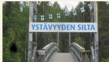
Ystäväyden silta koko komeudessaan