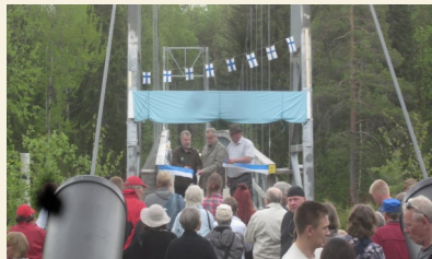
Ystäväyden sillan avausleikkaus