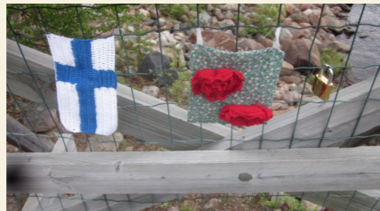
Käsityökerholaisten koriste ja ystäväyden lukko