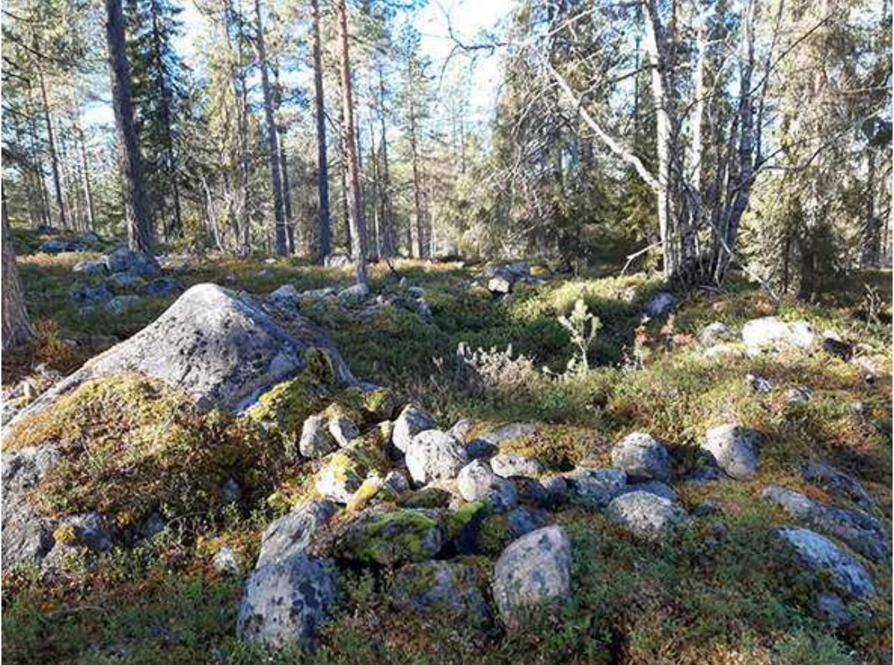
Kuva 1. Kehävalli kuvattu pohjoisluoteeseen. Vallin kaakkoispäädssä oleva luonnonkivi kuvan vasemmassa laidassa. ARK_20220929_0003

Kivinen kehävalli on karkeasti suorakulmainen, luode-kaakkosuuntaan rakennettu ja mitoiltaan noin 12 x 8 m. Valleilla on korkeutta alun toista metriä. Vallin keskusta on tasattu ja pohjalla on hiekkamaa, jossa on vankka huuhtoutumiskerros. Vallin kaakkoispäädystä on luonnonkivi, josta vallit lähtevät kiertämään. Luoteispäädyn vallissa on kiinni rakenteellinen ”lisäosa”, joka on purnumainen noin 3 m halkaisijaltaan oleva pienempi kivikehä/kuoppa.