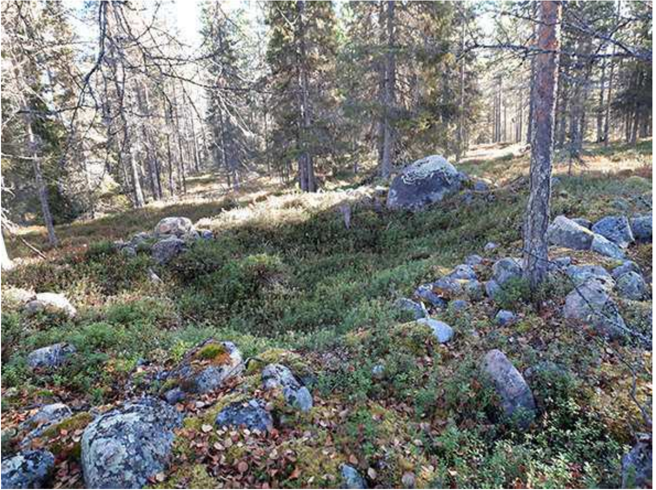
Kuva 3. Kehävalli kuvattu itään. ARK_20220929_0005