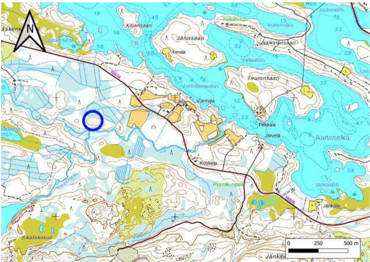
Kartta 1. Kohteen sijainti.