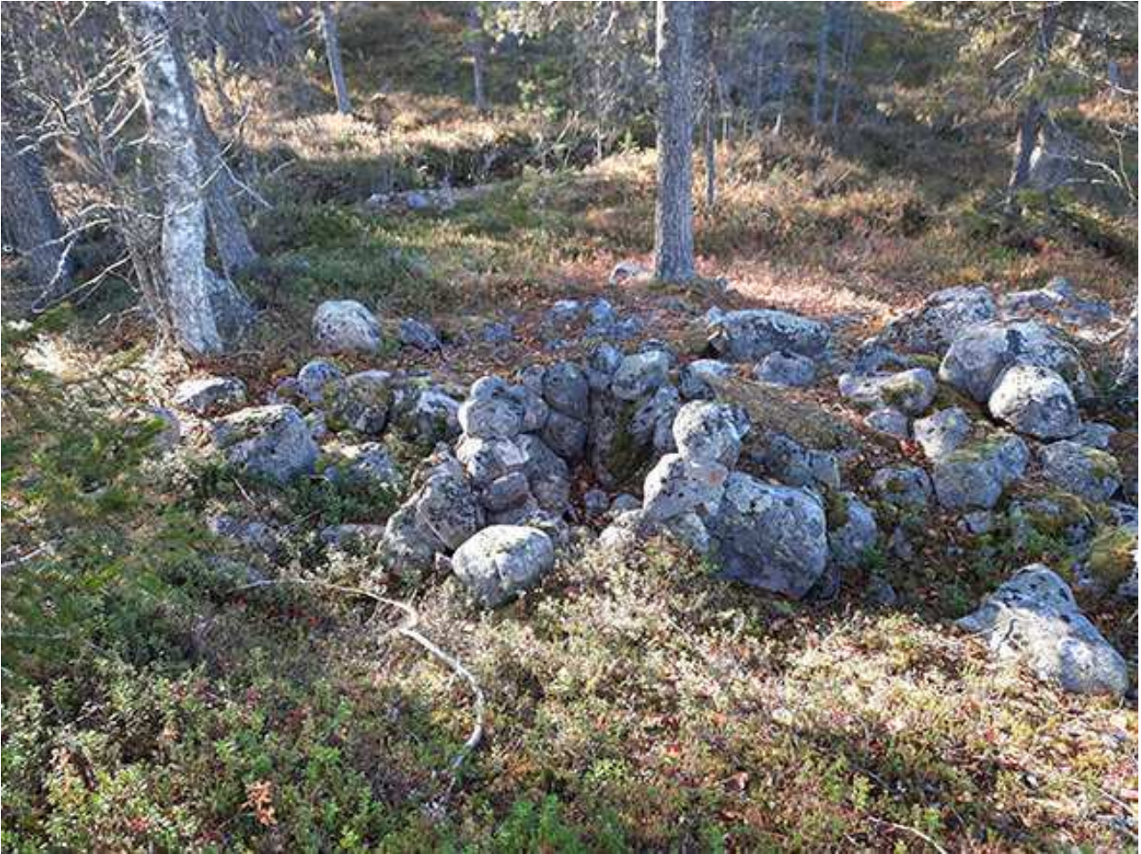
Kuva 4. Purnu kuvattu lounaaseen. ARK_20220929_0002

Noin 1 m halkaisijaltaan oleva kivistä huolellisesti ladottu pyöreä purnu. Koillissivultaan avonainen.