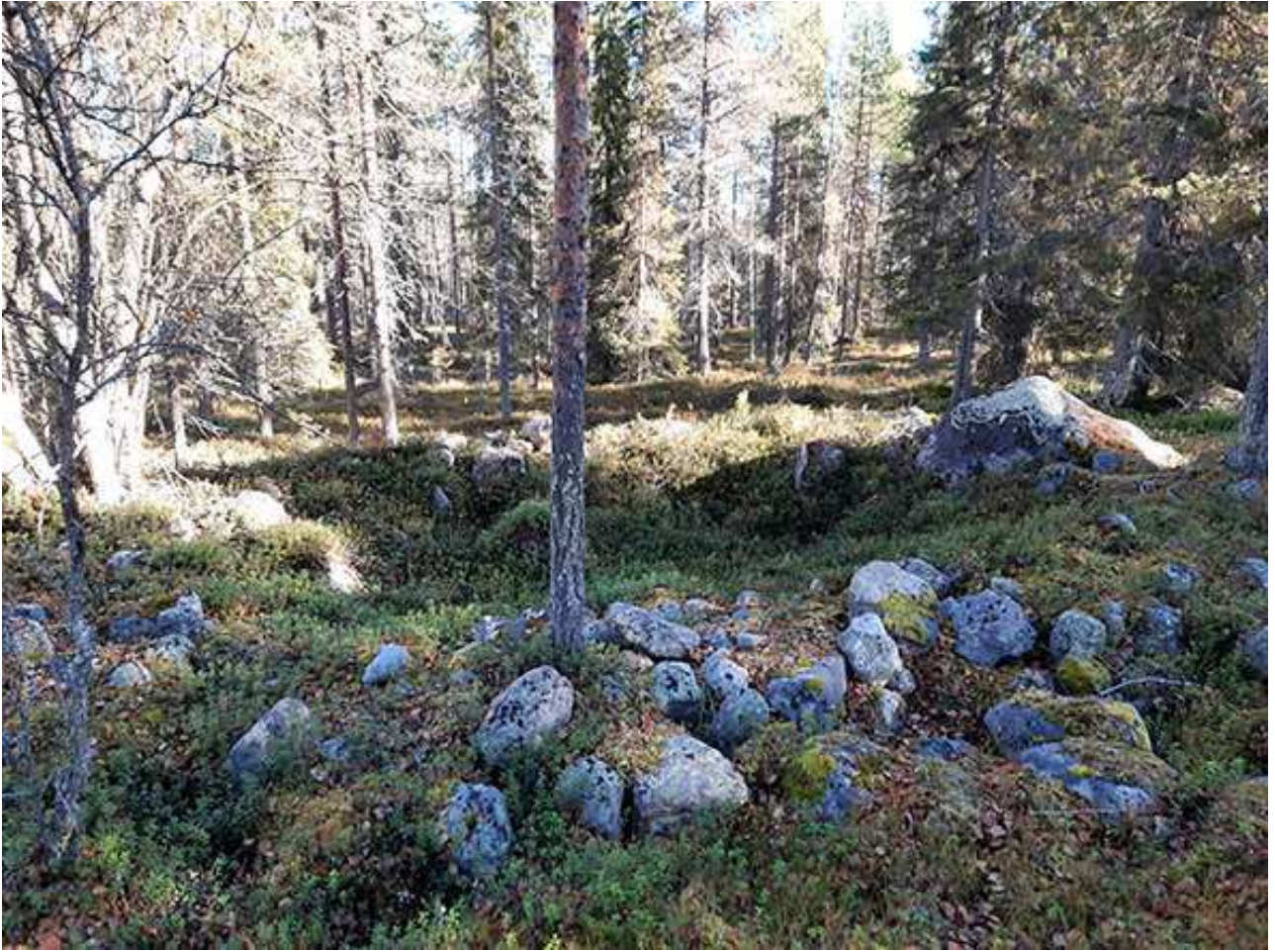
Kuva 2. Kehävalli kuvattu koilliseen. ARK_20220929_0004