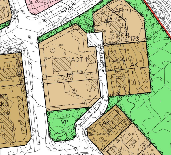
Kuva 4. Voimassa oleva asemakaava