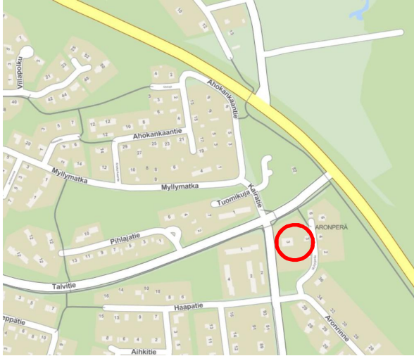
Kuva 2. Suunnittelualueen sijainti.

Osallistumis- ja arviointisuunnitelmassa (MRL 63 §) kuvataan kaavatyön tavoitteet ja lähtökohdat, valmistelun ja päätöksenteon eteneminen, kaavan vaikutusten arviointitavat sekä osallistumismahdollisuudet ja tiedottaminen. Osallistumis- ja arviointisuunnitelmaa päivitetään kaavatyön eri vaiheissa tarvittaessa.