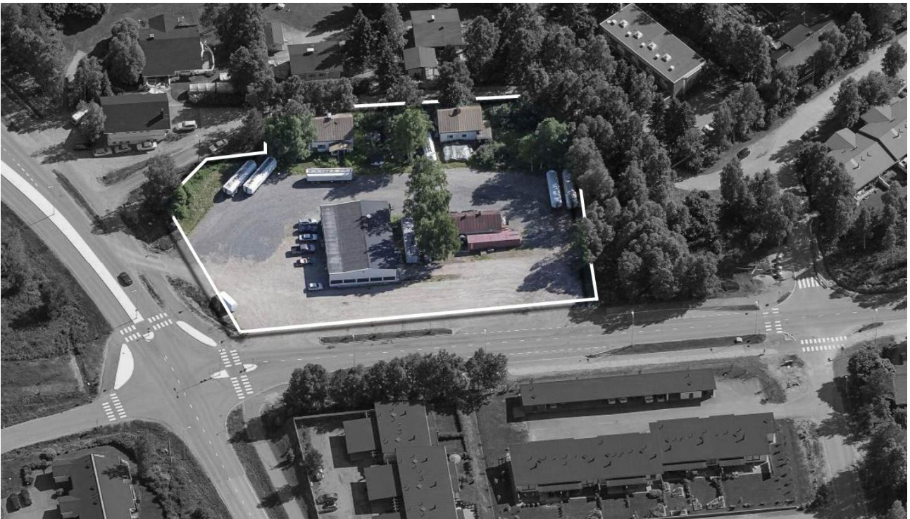
Kuva 1. Ilmakuva suunnittelualueesta