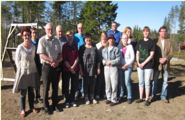
Aluelautakunta kokoontui toukokuussa 2013 Perunkajärvellä.