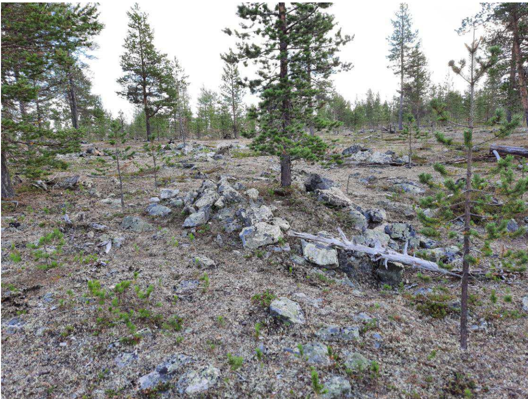
Kuva 1. Siella-aavan latomus kuvattuna itään.

Latomus sijaitsee kaltevassa maastonkohdassa ja on mitoiltaan n. 3,2 x 1,8 x 0,4 m (ks. kuva 1 ). Se on koottu verrattain tasakokoisista kivistä ja rakennustapa vaikuttaa huolelliselta. On epätodennäköistä, että kyseessä on liesi, koska rakenne on koottu kaltevaan maastonkohtaan kun ympärillä olisi runsaasti tasaista maata. Kohteen lähistöltä ei todettu tarkastuksen aikana muita ihmisen tekemiä rakenteita, joskaan alueen tarkkaan läpikäymiseen ei ollut aikaa.