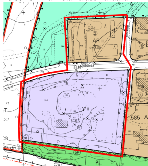
Kuva 4. Voimassa oleva asemakaava ja aluerajaus

Korttelin 585 tontin 7 osalta on voimassa sisäasiainministeriön 07.03.1972 ja korttelin 551 osalla 15.08.1974 vahvistama asemakaava.