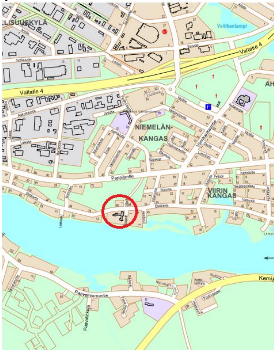
Kuva 2. Suunnittelualan sijainti

Kaavamuutosalue sijaitsee 5. kaupunginosassa Eteläranta ja Villentien risteysalueella. Vaikutusalue käsittää lähiympäristön kortteli- katu- ja virkistysalueet.