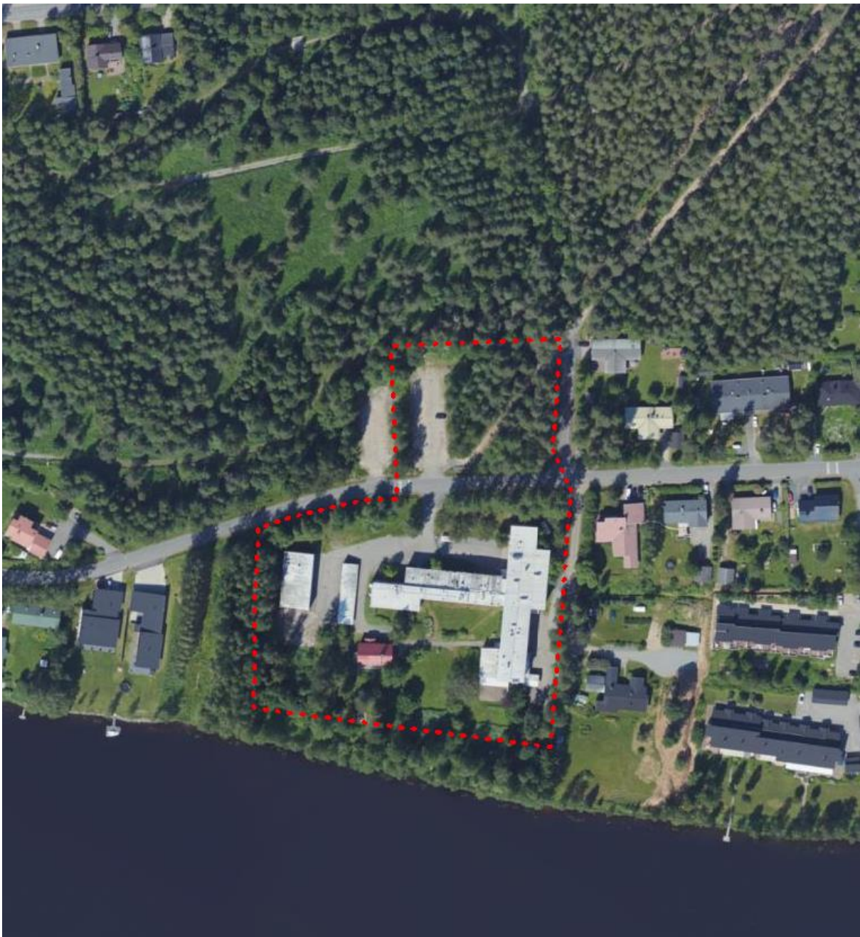
Kuva 1. Ilmakuva (2021) ja rajaus suunnittelualueesta

5. kaupunginosa kortteli 551 ja korttelin 585 tontti 7 sekä katualue, Eteläranta