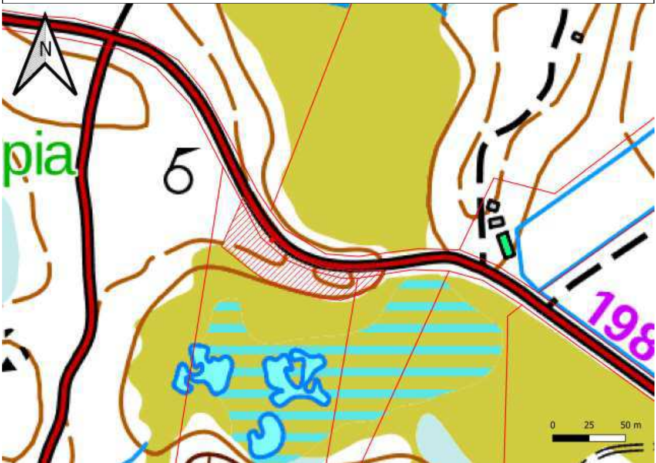
Kartta 2. Kohde 1000045811.

Paikalta on löytynyt metallinetsinnässä suorasiivinen, kaarevaselkäinen ja nelikorvakkeinen myöhäiselle rautakaudelle ajoittuva kirveenterä. Esine löytyi aivan pintamaan alta hiekan pinnasta läheltä tieojan reunaan, mutta kuitenkin koskemattomasta maasta, joten se ei ole ollut sekundäärissä kontekstissa. Tarkastuksessa kirveen löytöpaikalta todettiin noensekainen huuhtoutumiskerros. Kyseessä lienee maan pinnalle tehty rakenteeton polttohaudaus, jos kohta palanutta luuta tarkastuksessa ei löydetty. On mahdollista, että hautoja on ympäristössä enemmänkin.