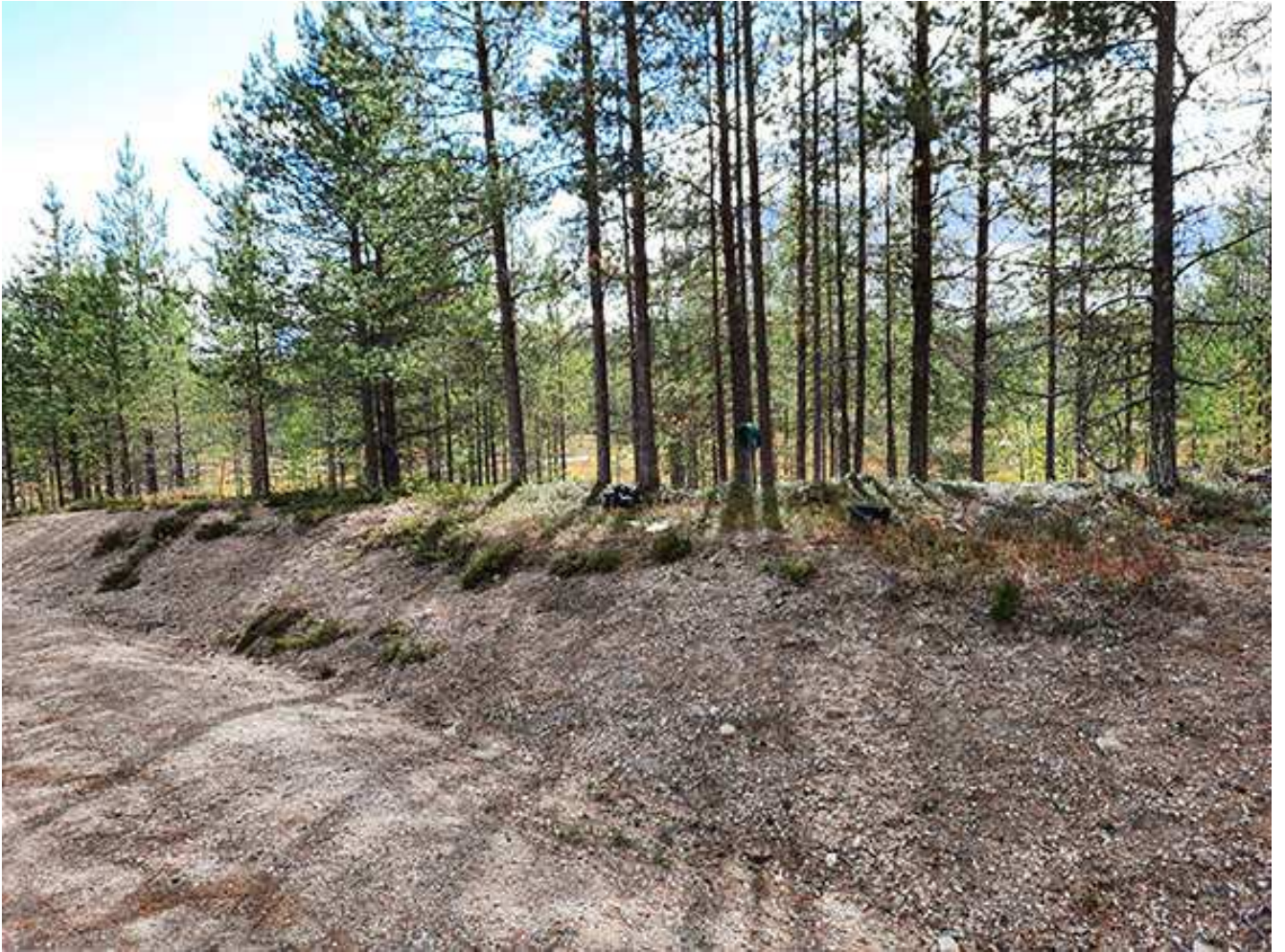
Kuva 1. Löytöpaikka (merkitty kairalla, jonka päässä vihreä muoviseula) kuvattu kaakkoon. ARK_20220905_0011