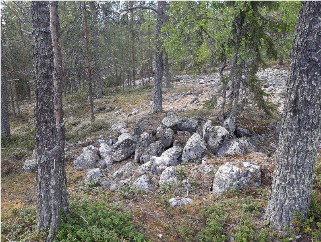
Purnu kuvattu länteen. ARK_20220531_0005