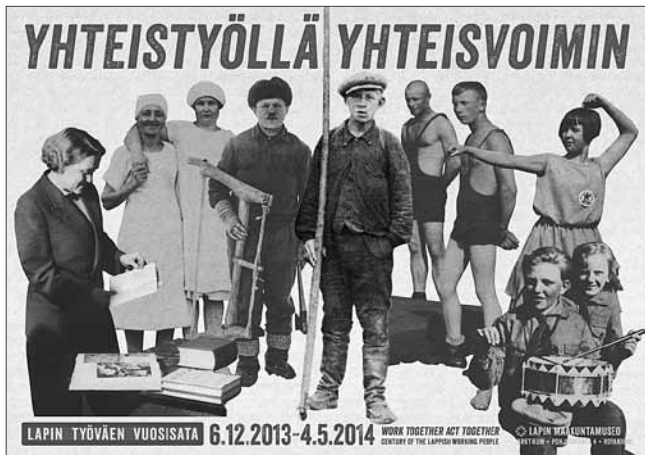
Näyttelyjuliste: graafikko Ulla Etto.

Lapin maakuntamuseo sai keväällä 2013 Museovirastolta harkinnanvaraista avustusta Kyläillä ja keskustella -näyttely tiedonkeruun ja -jakamisen välineenä -hankkeeseen. Avustus antoi mahdollisuuden etsiä uusia tapoja talentaa, esittää ja jakaa tietoa. Yhteistyöllä-näyttelyssä voi perehtyä aiheeseen syvällisemmin lisätyn todellisuuden avulla (augmented reality). Näyttelykävijä voi ladata mobiililaitteeseensa lisätyn todellisuuden sovelluksen ja sen avulla päästä mm. kuuntelemaan työvä-