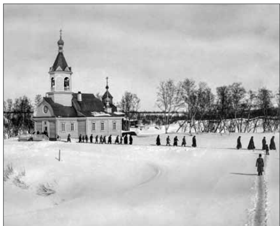
Munkkeja poistumassa Yläluostarin kirkosta vuonna 1911.

Parkkinassa pysähdyimme paikalle, jossa ennen oli ollut kirkko ja hautausmaa. Autiolla alueella kirkon sijainnin näki vain maassa olevasta syvänteestä ja paikalla olevista puisista ortodoksisista risteistä. Parkkinan suomalaisista ajoista muistutti käytössä oleva entinen Suomen Petsamon aluesairaala (valmistunut vuonna 1933), joka on armeijan käytössä. Lähistöllä on suuri ja siisti ruoho-