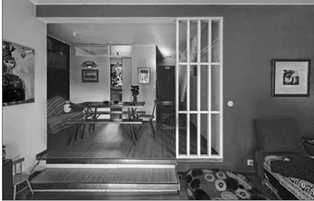
Näkymä rivitalo-asunnon olohuoneesta ruokailutilaan ja keittiöön.