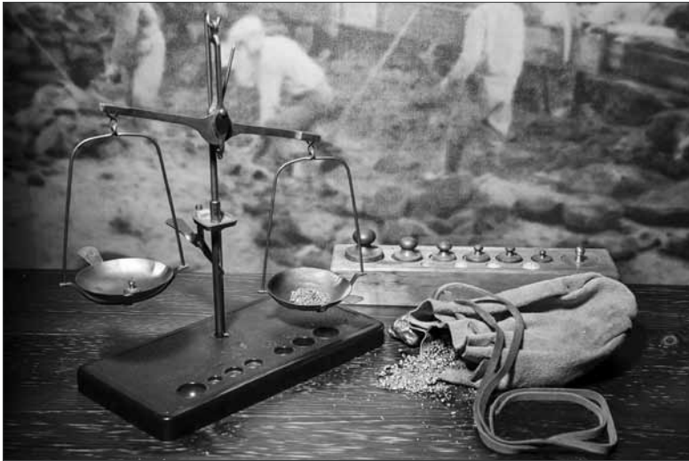
Lapin kultahistoriaan kuuluu olennaisesti kultavaaka.

kohtarakennuksen itselleen. Rakennus siirrettiin ja pystytettiin pääosin talkoovoimin, ja peruskiven muuraajana toimi kesällä 1977 itse tasavallan presidentti Urho Kekkonen.