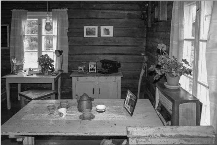
Palsan kotimökin interiöörissä on palattu 1950- ja 1960-luvuille.