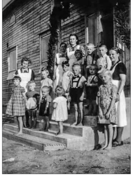
Lapsia ja henkilökuntaa Ranuan lastenkodin ulkoportaitailla.

Monet järjestöt ja liitot, kuten suojeluskunnat, Lotta Svärd, Rajaseudun ystävien liitto, Mannerheim-liitto, työväenjärjestöt ja Lapin maatalouskerhopiiriliitto olivat mukana perustamassa lastenkoteja Lappiin. Ranualla lastenkoti saatiin vuonna 1942, kun Suomen Punainen Risti suunnitelti perustavansa Ranualla lastenkodin. Tarvittava tontti saatiin lahjoituksena kunnalta. Kenraali Mannerheimin Lastensuojeluliiton paikallisosasto oli perustettu Ranualla neljä vuotta aiemmin.