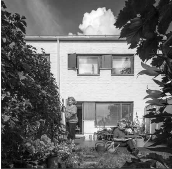
Tapiolan rivitalo- asuntoihin kuuluu oma piha.

liskon modernismi näyttää melko hyvin vastaavan nykyajan vaatimuksia. Sijainti ja ympäristö olivat pääasiallinen syy valita asuinpaikaksi juuri Korkalorinne. Asukkaat arvostavat suuresti alueen sijaintia kävelymatkan päässä kaupungin keskustasta sekä ainutlaatuista luonnonympäristöä. Asuinalue sijaitsee Korkalovaaran etelärinteellä, ja pienet metsäalueet sekä puutarha-arkkitehdin suunnittelema puisto ympäröivät sitä.