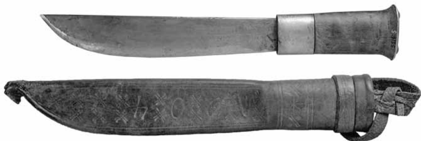
Inarista peräisin oleva itäisen tyyppin nahkatuppileuku, jonka tupessa on vuosiluku 1904. Kansallismuseon kokoelmat.

Leu’un syntymiseen johti tarve löytää kirvestä käytännöllisempi ja kevyempi matkatyökalu pohjoisella vyöhykkeellä, josta täyskasvuisten puiden sijaan saattoi löytää nuotiotarpeiksi vain vaivaiskoivuja ja muita pensasmaisia