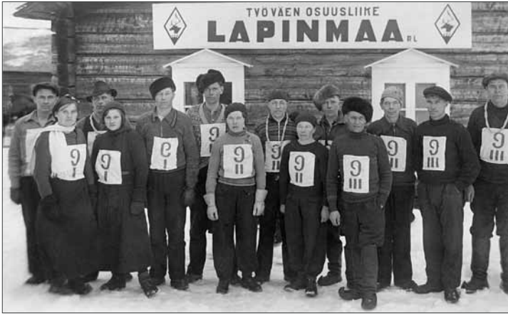
Kittilän ja Kaukosen myymälän voitokas viestijoukkue 1920-luvun lopulla.

Lappiin syntyi puolueosastoja, ammattiosastoja ja työväen osuustoimintaa muun Suomen tapaan. Erityisolot loivat kuitenkin haasteensa toiminnalle vielä sotien jälkeenkin. Pitkät etäisyydet vaikeuttivat työväenliikkeen ja ammattiyhdistysliikkeen toimijoiden ja matkapuhujien kulkua. Monia ihmisiä oli vaikea tavoittaa myös siksi, että nämä liikkuvat työn perässä paikasta toiseen.