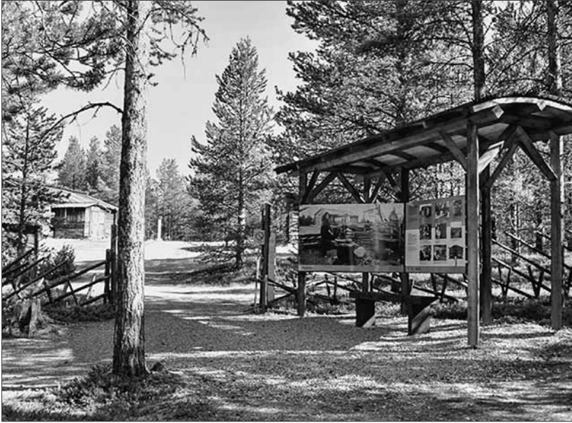
Vanha ulkomuseo on nykyään osa saamelaismuseo-luontokeskus Siidan näyttelytarjontaa.

laatuisten ulkomuseoalueen museaalisen historian tallennukseen.