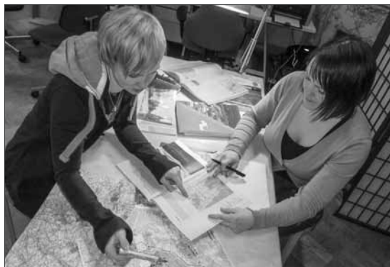
Inventoinnin aikana kertyi tuhansia ajokilometrejä, mutta myös toimistolla vietettiin aikaa taustoja selvittäen.

Maastokäynnit tehtiin pääosin autolla kylästä toiseen kurvaillen. Lapin kuuluisat pitkät välimatkat lyhenivät kummasti hyvässä inventointiseurassa ja kiinnostavia, kauniita kyliä tarkasteltaessa. Ajo-kilometrejä kertyi useita tuhansia, valokuvia varmaan toinen mokoma. Parhaat kuvat kustakin kohteesta valitaan arkistoitaviksi muun inventointimateriaalin kanssa. Jokaisesta kohteesta on tehty lyhyt aluekuvaus sekä selvitetty jo ennen maastokäyntejä kohteen sijaintiin, kulttuurihistoriaan, tyyppillisiin elinkeinoihin ja maiseman erityispiirteisiin liittyviä tietoja.