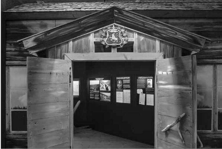
Kultamuseon näyttelyihin käydään sisälle Lapin kultahistorian kautta.