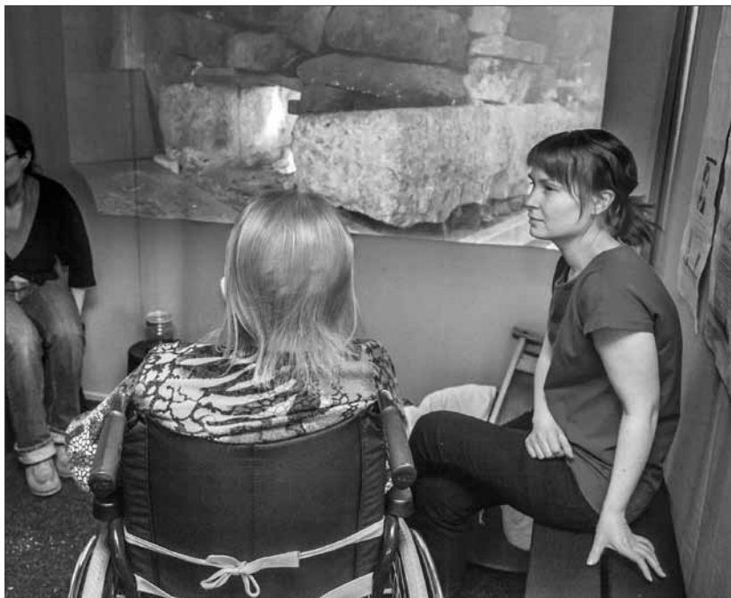
Muisteluhetki moniaistisessa tilassa.

Muistitiedot ovat museoissa yleensä esineiden ja valokuvien kontekstittietoja ja tarinoita, jotka muodostavat kokoelmien ydinsisällön. Muistitietoa hyödynnetään laajasti näyttely- ja tutkimustoiminnassa, mutta sillä on myös laajempi merkitys. Muistitiedosta rakentuu tietyn alueen tai ihmisryhmän yhteinen kulttuurinen omaisuus. Uudenlaista ajattelua on, että keräämisen ja tallentamisen ohella museo osallistuu vastavuoroisesti muistitiedon jakamiseen muistelijoiden