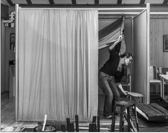
Saunatilan pystytys.

Hattunen suunnitteli ja toteutti varsinaisen moniaistisen ja siirrettävän telttatilan toimivaksi kokonaisuudeksi syksyllä 2012. Muistelutilaa voidaan hyödyntää erityisesti museorakennuksen ulkopuolella: jalkautumalla kirjastoihin, hoitokoteihin ja syrjäkyliin. Näin tavoitetaan asiakasryhmiä, joille museon palveluiden käyttäminen olisi muuten vaikeaa.