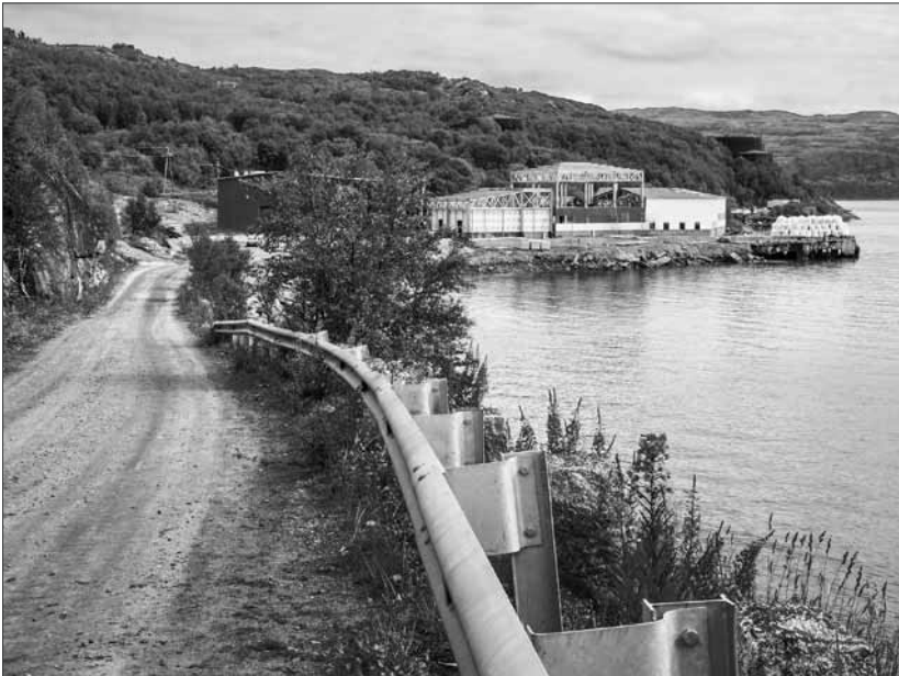
Entisen kalajauhotehtaan paikalle Liinahamarissa rakennetaan kalanjalostuslaitosta. Taustalla näkyvät ruosteiset öljysäiliöt.

Linja-autoon nousi venäläinen opas ja lähdimme ajamaan kohti Liinahamaria. Trifonan portilla sotilaat suorittivat meille nimenhuudon ja portti nostettiin ylös.