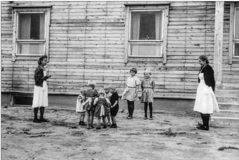
Pihaleikkihetki Ranuan lastenkodilla.

Koivistot muuttivat pois uuden kaupan valmistuttua, ja lastenkodilapset palasivat evakosta. Ruotsiin evakuoitua palasivat kuitenkin vasta vuonna 1946. Lastenkodin tärkeä rooli jälleenrakennuksessa konkretisoitui siinä, että se toimi eräänlaisena kansanhuollon toimipisteenä evakosta palaaville, ja lisäksi sieltä saatiin ostettua tui-ki tarpeellista rakennustavaraa.