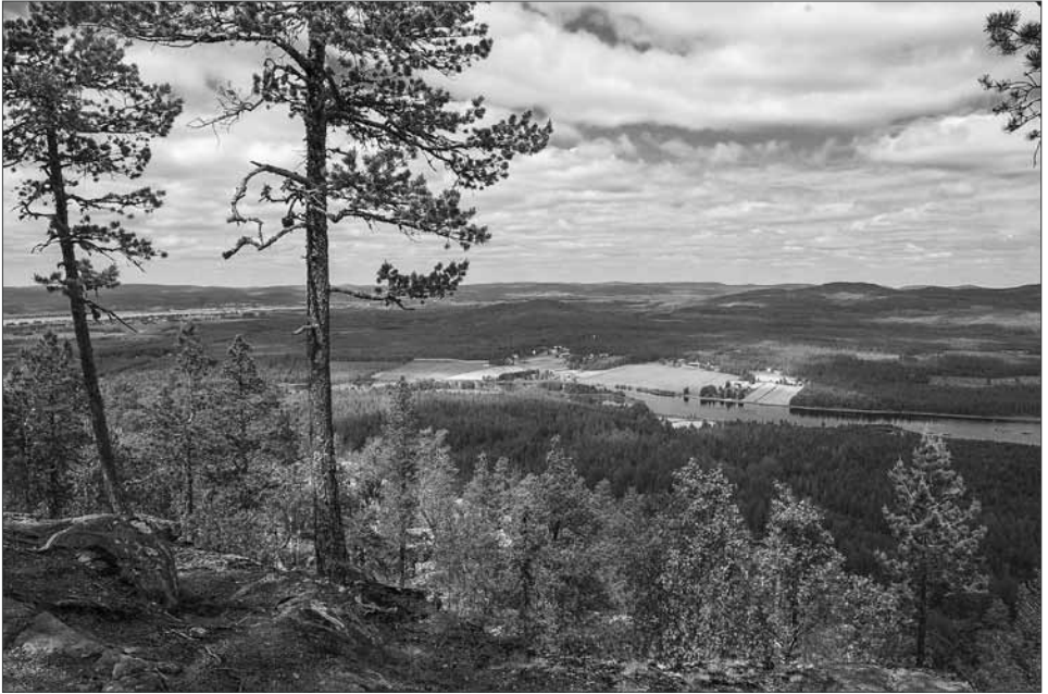
Tornionlaakson maisemia Aavasaksan huipulta.

Kalastus, metsästys ja keräily muodostivat heti jääkauden jälkeän pyyntiyhteisöjen elämän perustan. Ilmastolliset olot ovat rajoittaneet varsinkin pohjoisimpien seutujen viljelymahdollisuuksia. Maatalous on tyypillisesti ollut sekataloutta; karjanhoitoa harjoitettiin rinnakkain erätalouden, suurkalastuksen ja poronhoidon kanssa. Parhaat edellytykset maataloudelle on ollut Tornionlaaksossa ja Kemijoen suulla. Näille alueille syntyikin talonpoikaisasutusta jo varhaisella keskiajalla. Jokilaaksojen talonpojille lohen- ja siiankalastus oli tärkeä elinkeino, jota maatalous tuki.