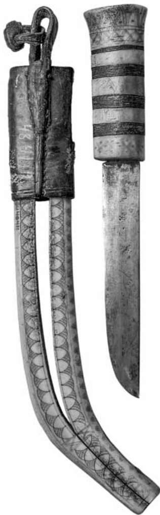
Läntisen tyyppin puolisarvituppileuku, joka on valmistettu 1800-luvun jälkipuolella. Poronsarvisessa kahvassa on kaiverruskoristelua ja tuohilapot. Sarvitupille on ominaista käyrä alaosaa. Kansallismuseon kokoelmat. Kuva: Anssi Ruusuvuori.

Suomalaiset leu'ut kuuluvat koristelunsa puolesta samaan alueeseen Pohjois-Ruotsin ja -Norjan sekä Venäjän Lapin kanssa. Sarvitupen kaiverruskoristelu ei täytä