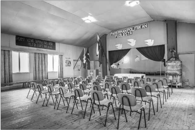
Kallon työväentalo.

enlauluja ja katselemaan videoita. Lisätty todellisuus yhdistää reaali- ja digitaalista maailmaa, ja sen käyttöä testataan nyt Lapin maakuntamuseossa ensimmäisen kerran.