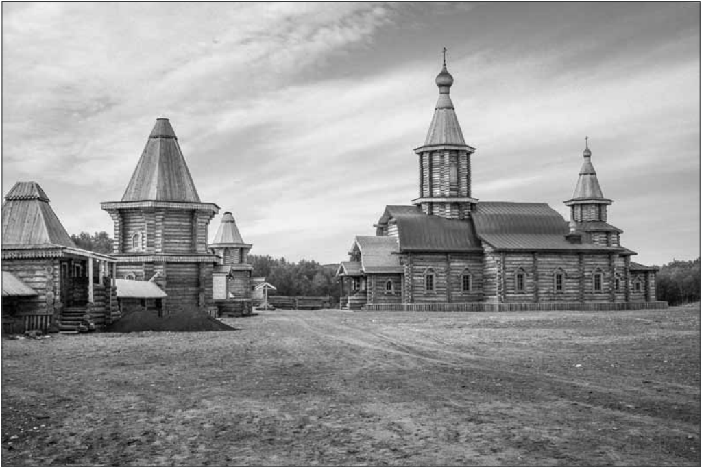
Vuonna 2007 palaneen Yläluostarin kirkon viereen on rakennettu uusi kirkko edeltäjänsä muotoja mukaillen.

josta tuli mieleen keskiaikainen linnoitus. Matkailijoille on rakennettu siistit käymälätilat ja viihtyisiä turistikauppa, ensi kesäksi pitäisi valmistua majoitus-tilat. Luostari vaikutti hiljaiselta, mutta toivoa täynnä olevalta paikalta.