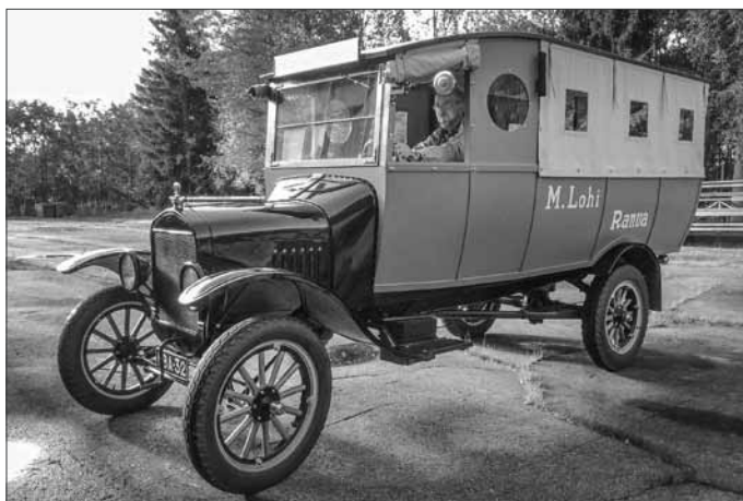
Museorekisteriin kuuluva Ford Model TT.