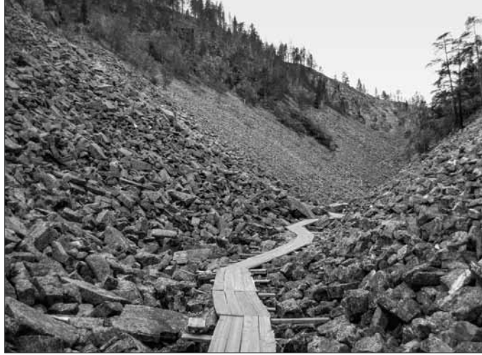
Näyttäviä taluskivikoita Pelkosenniemen Aittakurussa.

vyöryneistä kivistä ja lohkkareista. Roudan aikaansaamia kivikoita ovat lähinnä soiden reuna-alueilla esiintyvät lohkkarepainanteet eli uhkurakat. Erilaiset virtaavan veden kerrostamat kivikot ovat syntyneet pääosin mannerjäätikön sulamisvaiheessa. Muinaisen Itämeren vaiheiden jälkeensä jättämät rantakivikot on huomioitu jo aikaisemmassa tuuli- ja ranta-kerrostumia koskevassa arvotustyössä. Moreenimailla, varsinkin kumpumoreenimuodostumien pinnalla esiintyy kivi- ja lohkkareti-hentymiä, jotka huomioidaan. Lisäksi arvotetaan joitakin tärkeitä siirtolohkkareita.