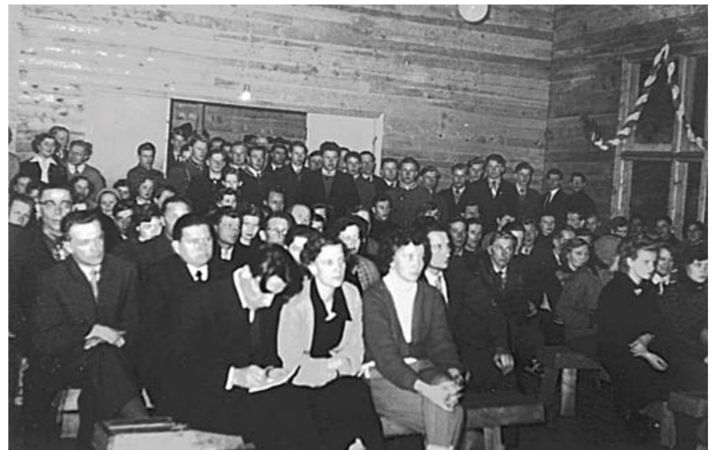
Maaseudun Nuorten Liiton talvipäivät Jokkapirtillä 1955.