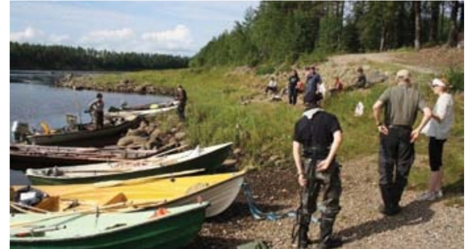
Kemijokisoudun veneet rantautuneena.

Soutamalla vapaan Kemijoen puolesta haluan estää, että me Kemijoen varren asukkaat joutuisimme jälkikäteen, sitten kun kaikki on jo myöhäistä, kauhuissamme toteamaan, kuinka suunnattoman tuhon