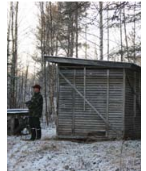
Kirjolohen kasvatushäkki, joka on nostettu maalle.