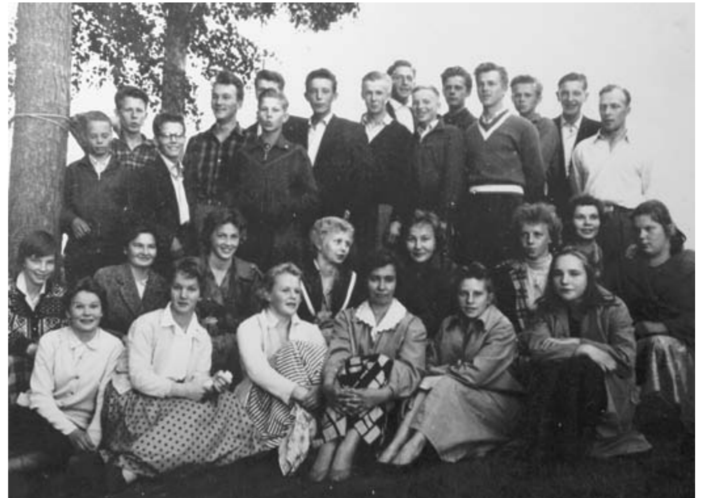
Oikaraisen kylän nuoriso kokoontuneena Aholassa 50-luvulla.

Teksti: E. Yliraudanjoki